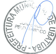
AGNELO CINEL Secretário Municipal de Segurança Pública e Defesa Social