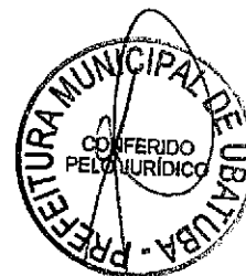
EMDURB – EMPRESA MUNICIPAL DE DESENVOLVIMENTO URBANO REPRESENTANTE LEGAL