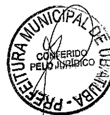
PEDRO VICENTE TUZINO LEITE Secretário Municipal de Serviços de Infraestrutura Pública