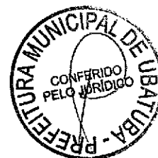
L 23 MULTISUPRIMENTOS E SERVIÇOS LTDA - ME Representante Legal