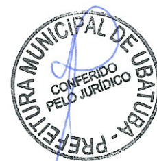
SANEPAV SANEAMENTO AMBIENTAL LTDA Representante Legal