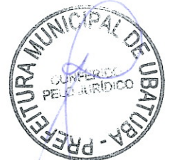
PEDRO VICENTE TUZINO LEITE Secretário Municipal de Serviços de Infraestrutura Pública