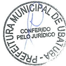
PEDRO VICENTE TUZINO LEITE Secretário Municipal de Serviços de Infraestrutura Pública