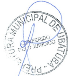
ELAINE PINHO GONÇALVES PIMENTEL Secretária Municipal de Comunicação Social