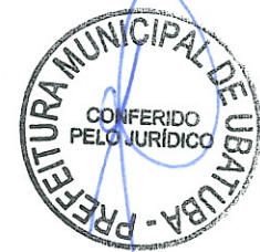
EMDURB – EMPRESA MUNICIPAL DE DESENVOLVIMENTO URBANO REPRESENTANTE LEGAL