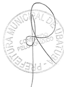
POLLYANA FÁTIMA GAMA SANTOS SECRETÁRIA MUNICIPAL DE EDUCAÇÃO