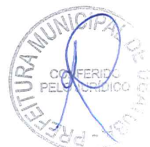
MICRO WORK INFORMATICA LTDA VÍTOR BASSI