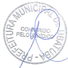
COOPERATIVA DE PRODUÇÃO E CONSUMO FAMILIAR NOSSA TERRA LTDA ADELMIR GAIARDO